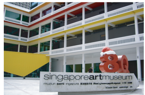
シンガポール/Shingapore Art museum 8Q