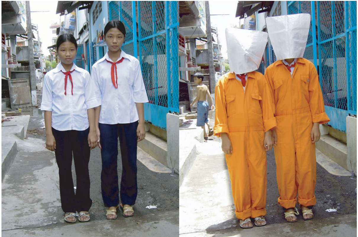
リチャード・ストレイトマター・チャン作品

コマンドNでは過去3年間にわたり、“アーティストが行う独自のアプローチによる、美術と地域社会の関係性「地域社会とアートプロジェクト」”をテーマに日本国内外のアートプロジェクトを紹介するProject Collectiveシリーズを展開してきました。本シリーズは2008年度よりアジア地域に視点を広げ、各国地域での活動に対するリサーチプロジェクトへと発展しています。