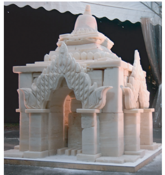
シンガポールビエンナーレ2008への出品作品

また、他にもベトナムホーチミン市を拠点としたアーティスト、建築家から構成されるアートユニットMOGAS STATIONに立ち上げから参加。ベトナム初となるバイリンガル現代美術雑誌「Aart」をアーティストの手により刊行。この雑誌媒体プロジェクト以外にも多くのアートプロジェクトを行っている。現在はQueensland art gallery(オーストラリア)のRussell storerとの共同キュレーションのもと、アジアパシフィックトリエンナーレにおけるメコン東アジア地域のアートプラットフォームの開発を行う。