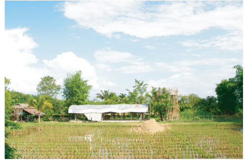
タイ/The Land foundation

Nha San Duc contemporary Art studio Dong Son Today Foundation Wonderful district A little blah blah San art Galerie Quynh